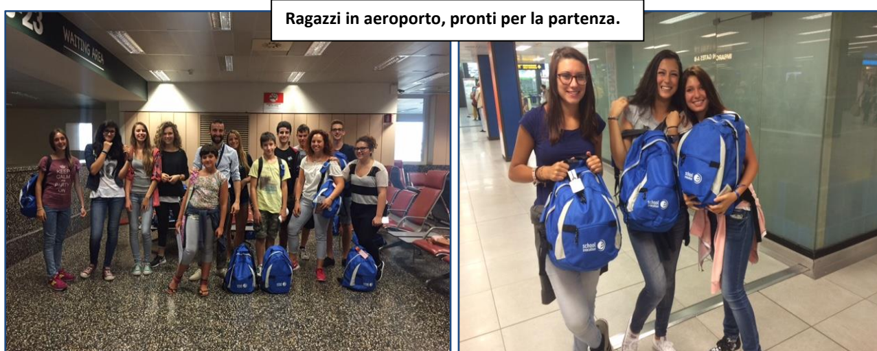
Ragazzi in aeroporto, pronti per la partenza.

Trasferimenti: Trasferimento in pullman privato A/R dall'aeroporto alla località di studio e viceversa.