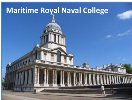
Maritime Royal Naval College

Maritime Royal Naval College è un maestoso complesso architettonico barocco patrimonio dell'UNESCO, progettato nel XVII secolo da Sir Christopher Wren. È situato nell'area di Greenwich in zona 2, sulla riva del Tamigi e dista circa 20 minuti dal centro di Londra, con il quale è ben collegato dalla metropolitana e dai mezzi di superficie. Dispone di classi moderne, aule computer, ampie aree comuni e una spaziosa mensa.