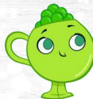
PEA CUP LA TAZZA PISELLINA