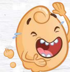
EGG SMELL L'OVETTO PUZZOSO