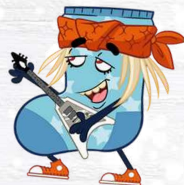
SOCK STAR IL CALZINO SUPERSTAR