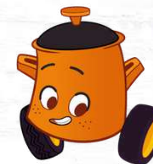
PARKING POT IL PENTOLINO PARCHEGGINO