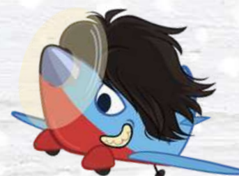
HAIR PLAN L'AEREO CAPELLONE