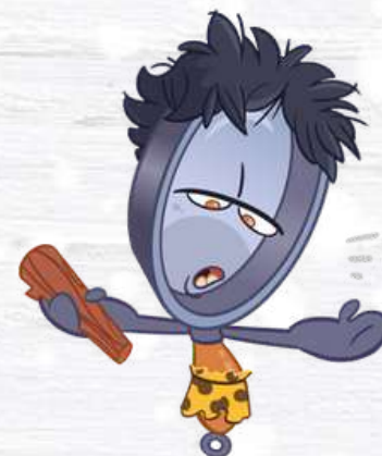
CAVE PAN IL PADELLONE PREISTORICO