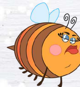
FUMBLE BEE L'APE PESTIFERA