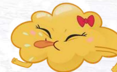
LEMON FART LA PUZZETTA AL LIMONE