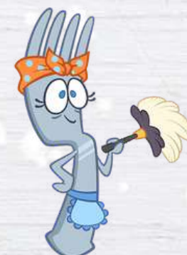
HOME FORK LA FORCHETTA CASALINGA