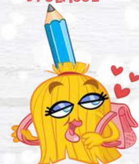
CLASS BROOM LA SCOPETTA DI CLASSE