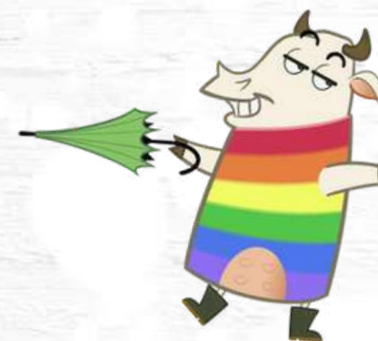
RAIN COW LA MUCCA DA PIOGGIA