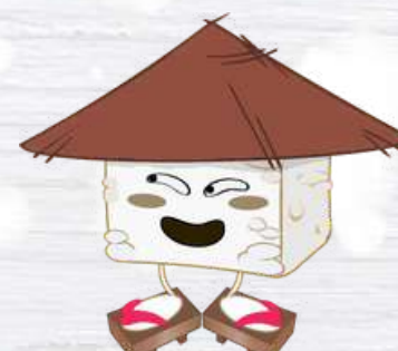
RICE CUBE IL CUBETTO DI RISO