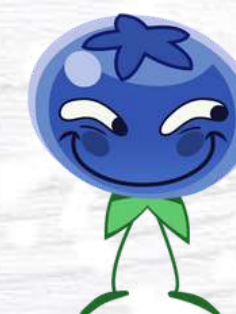
GLUE BARRY IL MIRTILLO APPICCICHINO